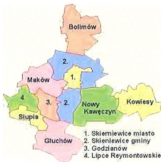
Rysunek 2. Położenie gminy Nowy Kawęczyn na tle powiatu skierniewickiego