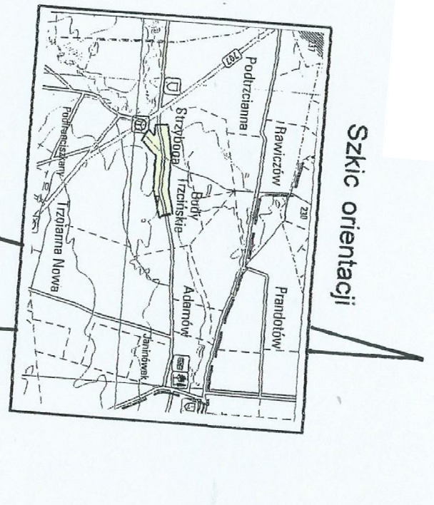
MAPA DO CELÓW PROJEKTOWYCH

Projektant: SBC, ul. Piłsudskiego 14, 10-100 Warszawa Wykonawca: SBC, ul. Piłsudskiego 14, 10-100 Warszawa Data wystawienia projektu technicznego: 04.10.2016 Numer projektu: 04.10.2016 Tytuł projektu: Projekt techniczny - wykonanie robót ziemnych i murarskich w ramach inwestycji w budowie obiektu biurowego przy ul. Piłsudskiego 14, 10-100 Warszawa Skala: 1:500 Zawiera: 1 arkusz